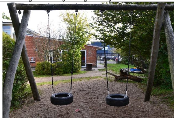
Redskab: Gyngestativ Årgang: 2008 Producent: Noles Er redskabet mærket: Ja Er der registreret fejl/mangler: Nej