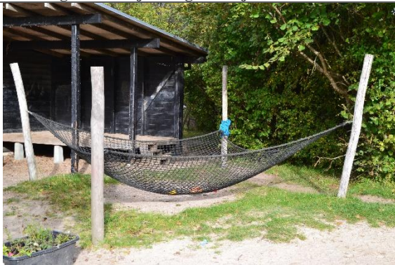
Redskab: Klatrenet Årgang: Producent: Cado Er redskabet mærket: Ja Er der registreret fejl/mangler: Nej