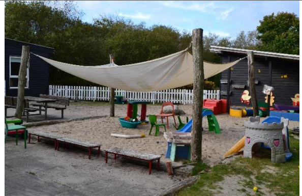
Redskab: Sandkasse med stolper til læsejl Årgang: Producent: 2008 Er redskabet mærket: Ja Er der registreret fejl/mangler: Ja