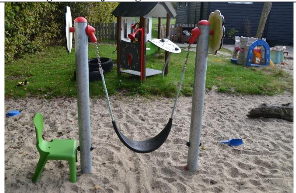
Redskab: Mavegynge Årgang: 2019 Producent: Kompan Er redskabet mærket: Ja Er der registreret fejl/mangler: Nej