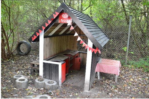
Redskab: Legehus Årgang: 2008 Producent: Esbjerg Tekniske Skole Er redskabet mærket: Er der registreret fejl/mangler: Nej