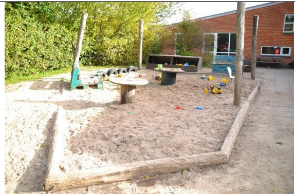
Redskab: Sandkasse Årgang: 2008 Producent: Er redskabet mærket: Ja Er der registreret fejl/mangler: Ja