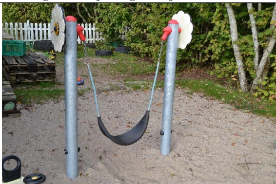
Redskab: Mavegynge Årgang: 2019 Producent: Kompan Er redskabet mærket: Ja Er der registreret fejl/mangler: Nej