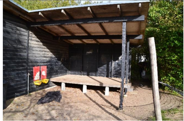
Redskab: Scene Ikke omfattet af DS/EN 1176