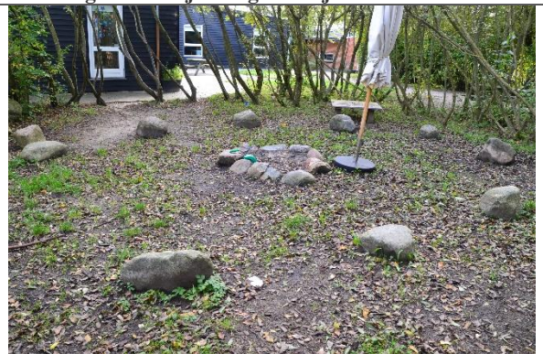
Redskab: Bålplads Ikke omfattet af DS/EN 1176