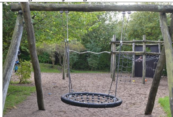
Redskab: Fugleredegynge Årgang: 1997 Producent: Noles Er redskabet mærket: Ja Er der registreret fejl/mangler: Nej