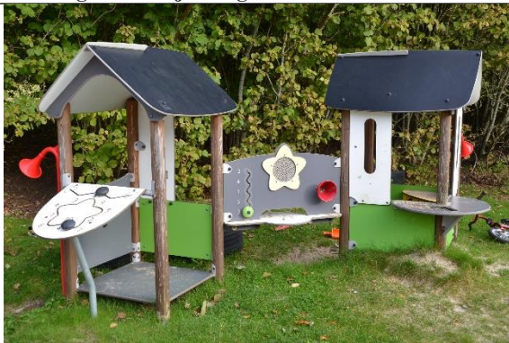
Redskab: Legehus Årgang: 2008 Producent: Hags Er redskabet mærket: Ja Er der registreret fejl/mangler: Nej