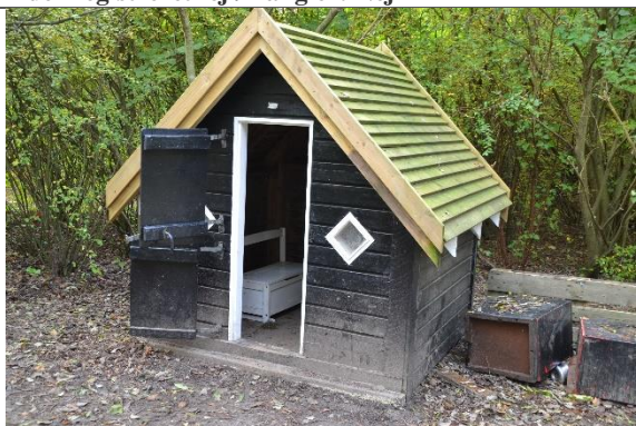
Redskab: Legehus Årgang: 2008 Producent: Er redskabet mærket: Nej Er der registreret fejl/mangler: Ja