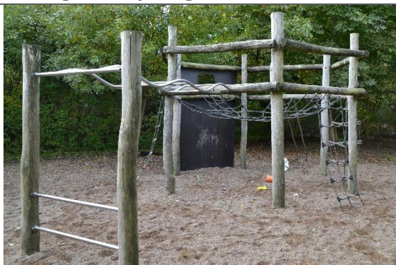
Redskab: Klatrestativ Årgang: 1997 Producent: Noles Er redskabet mærket: Ja Er der registreret fejl/mangler: Nej