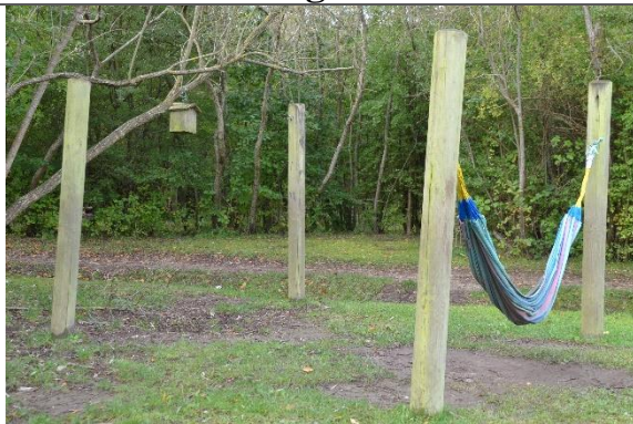
Redskab: Stolper til hængekøjer Årgang: Producent: Er redskabet mærket: Nej Er der registreret fejl/mangler: Nej