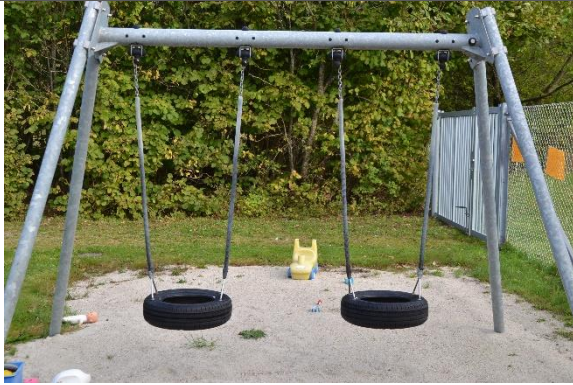
Redskab: Gyngestativ Årgang: Producent: Kompan Er redskabet mærket: Ja Er der registreret fejl/mangler: Ja