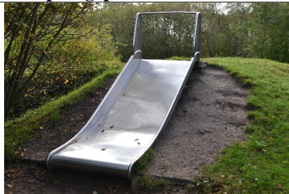
Redskab: Terrænruksjebane Årgang: 2008 Producent: Er redskabet mærket: Er der registreret fejl/mangler: Ja